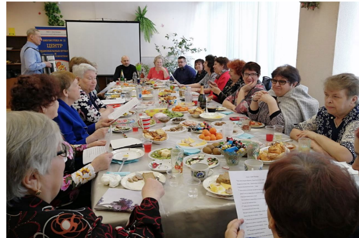
Праздник, посвященный дню 8 Марта