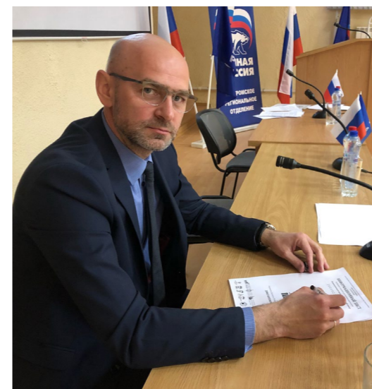
В апреле 2021 вместе со студентами КГУ впервые писал «Диктант Победы»