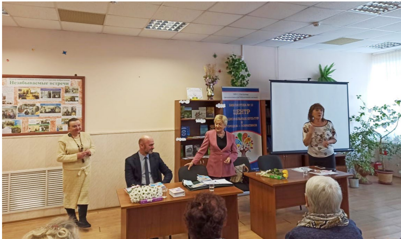
Встреча с Клубом поэтов