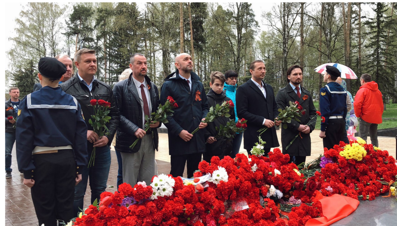
С коллегами из депутатского объединения партии «ЕДИНАЯ РОССИЯ» в Думе города Костромы возложили цветы к мемориалу славы «Вечный огонь».