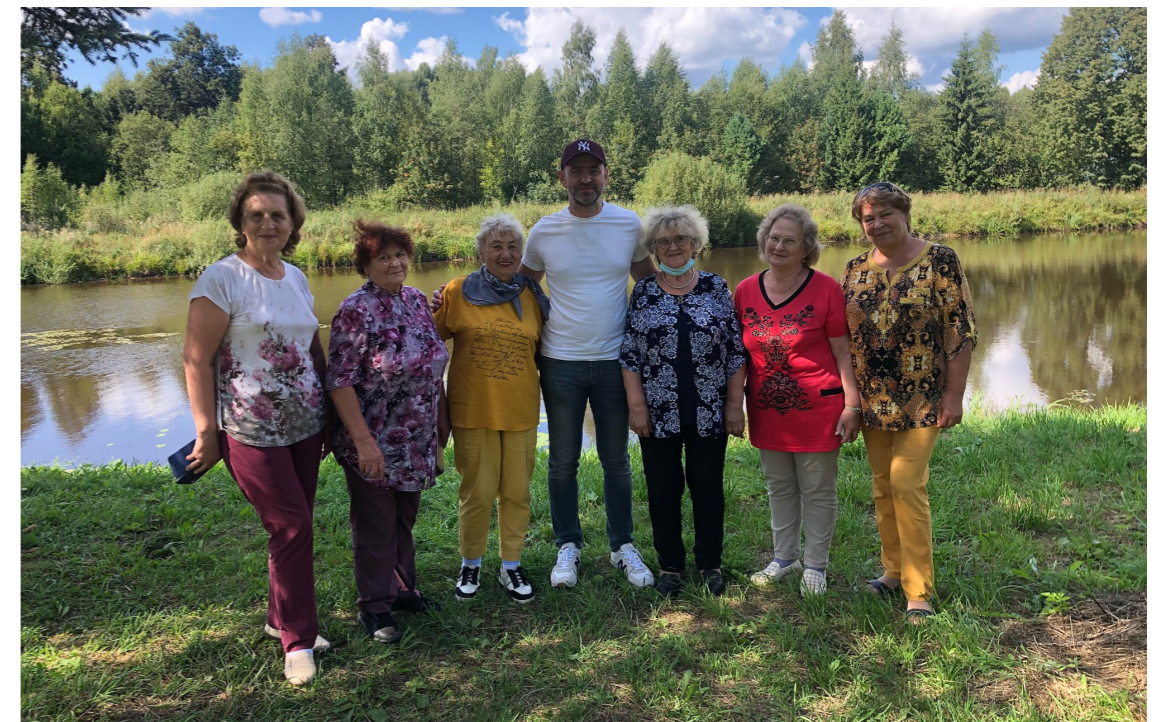
Выезд в Следово